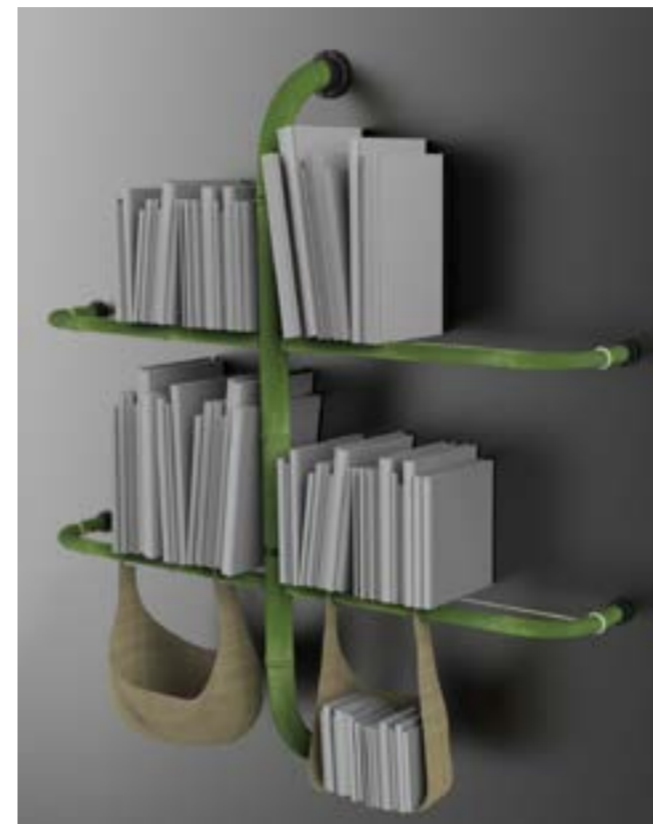
Fig.3 BamboBox (foto non riproducibile)