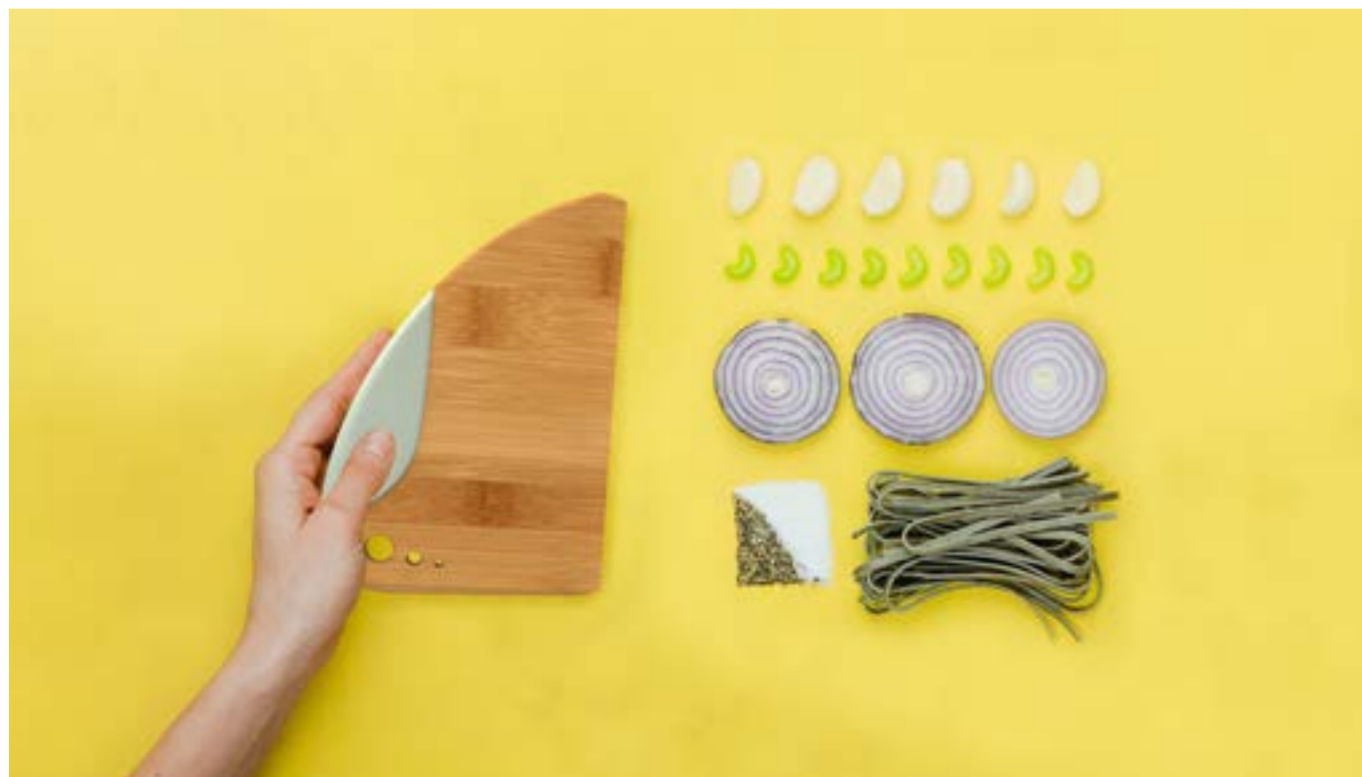
Fig.1 Lok (foto non riproducibile)

"Evento inaugurale, pionieristico per l'Italia il concorso internazionale BambooRush nasce con l'intento appassionato e un po' visionario di far conoscere e diffondere finalmente anche nel nostro paese, un materiale straordinario per il mondo del progetto. Un potenziale progettuale immenso, il "legno" più sostenibile al mondo, un'estetica, versatilità e proprietà tecniche uniche. Vero prodigio botanico un capolavoro di ingegneria e design della natura.