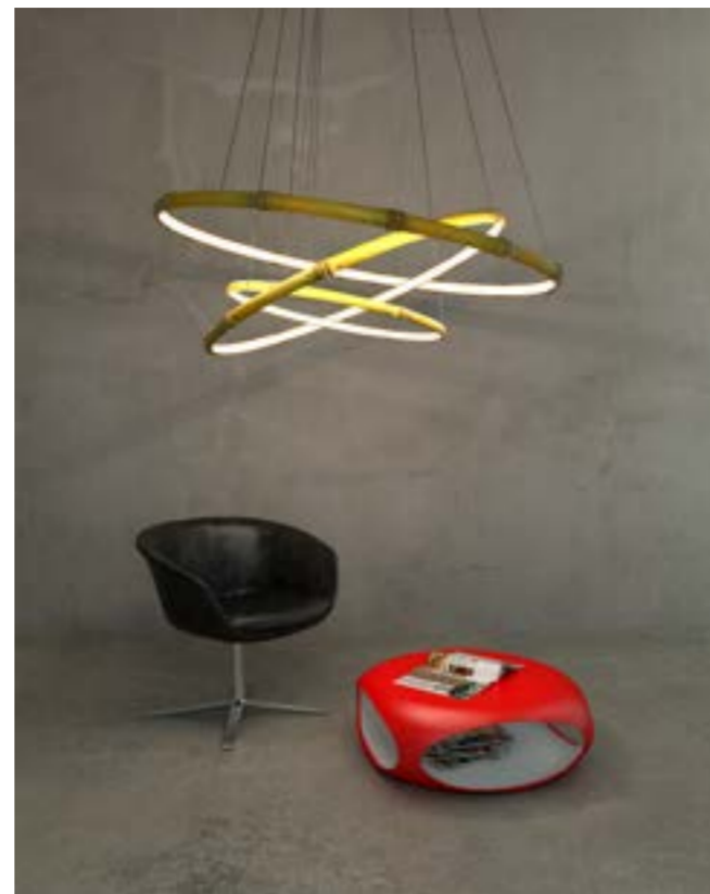
Fig.2 Inner Circle (foto non riproducibile)