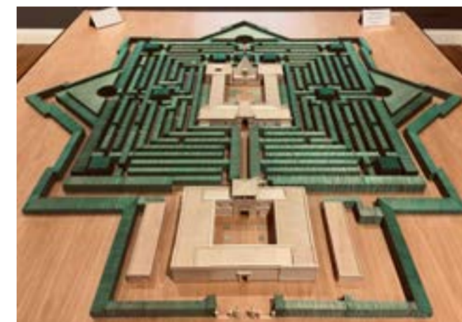
Fig.5 Plastico architettonico del Labirinto della Masone