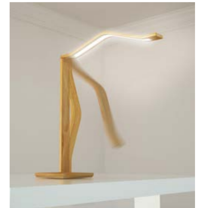
Fig.6 Vibra (foto non riproducibile)

La giuria internazionale sarà composta da autorevoli personalità che operano nell'ambito del Design e della Comunicazione. I nomi dei componenti della giuria saranno pubblicati sul sito della Fondazione entro il mese di giugno 2019.