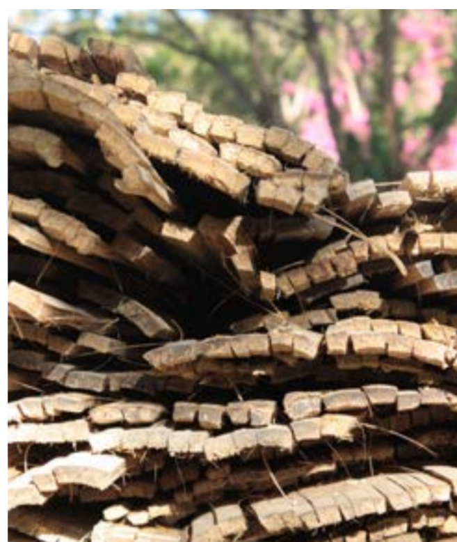
Fig.3 Lamelle di bambù per il semilavorato esterilla

Nel settore delle costruzioni, i culmi di bambù appartenenti alle specie Gigantochloa atrovioleacea e Phillostachys aurea sono, invece, spesso usati per realizzare oggetti di arredamento e rifiniture degli edifici. Il primo ha un bellissimo colore tra il viola scuro e il nero ed è utilissimo per finiture nella costruzione come le cornici delle porte, le cornici degli specchi e i passamani nei parapetti. I culmi appartenenti alla seconda specie vengono generalmente usati per la