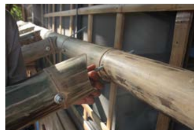
Fig.4 Dettaglio del collegamento a "bocca di pesce"

I progetti sperimentano i criteri bioclimatici, la