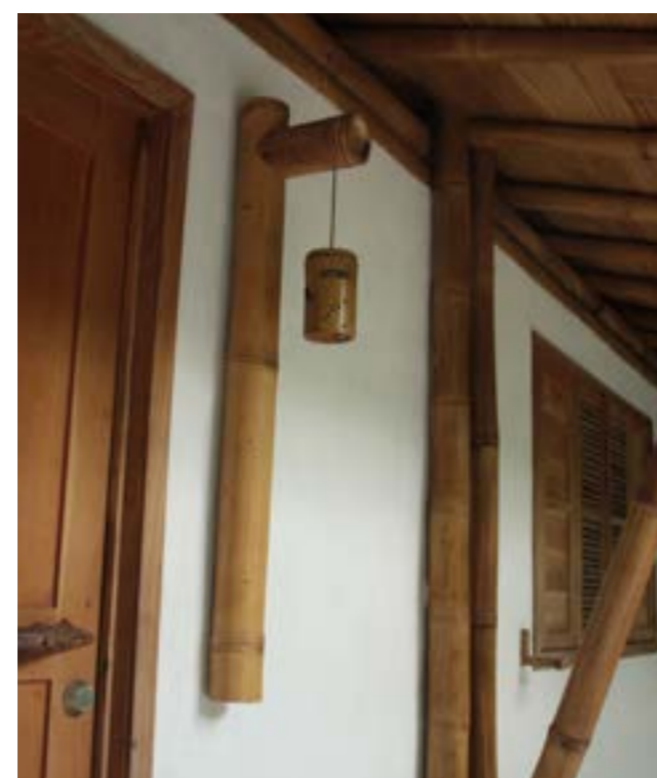
Fig.6 Dettagli ornamentali della casa

ventilazione trasversale con i tetti aperti per la fuoriuscita del calore e dell'umidità. I tetti sono prevalentemente ad una falda, sovrapposti tra di loro nel cambio delle pendenze, funzionanti e sperimentati nelle tempeste tropicali.