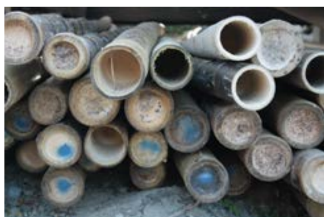
Fig.2 Culmi interi

Nel settore delle costruzioni, i culmi di bambù appartenenti alle specie Gigantochloa atrovioleacea e Phillostachys aurea sono, invece, spesso usati per realizzare oggetti di arredamento e rifiniture degli edifici. Il primo ha un bellissimo colore tra il viola scuro e il nero ed è utilissimo per finiture nella costruzione come le cornici delle porte, le cornici degli specchi e i passamani nei parapetti. I culmi appartenenti alla seconda specie vengono generalmente usati per la