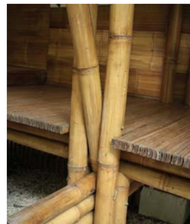
Fig.7 Collegamento pilastro-trave a terra

Le pareti, anche in questo caso realizzate in esterilla, si ancorano alle canne verticali inserite a distanza regolare tra la struttura portante. Le pareti così realizzate garantiscono una minima