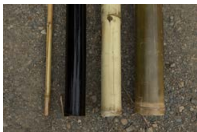
Fig.1 Bambù usati nelle costruzioni

Nel mercato italiano lentamente il bambù si sta facendo spazio anche in sostituzione dei legni pregiati esteri ormai proibiti. I bambù più usati sono appartenenti alle specie Guadua angustifolia e Dendrocalamus asper , le specie tropicali adatte per costruire edifici anche multipiani. Sono bambù di grosse dimensioni, il diametro di questi culmi si aggira, infatti, mediamente attorno ai 150 mm (alcuni culmi raggiungono anche i 200 mm di diametro) ed hanno una lunghezza utile di circa 13 m. Dagli stessi bambù si ricavano molti semilavorati di cui il principale è l' esterilla : il culmo viene aperto e, con opportuni tagli e con lo schiacciamento dei nodi, si ottiene un pannello di circa 300 mm di larghezza.