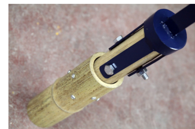
Fig.3 Prototipo di connessione realizzato con legno, viti autofilettanti e perni in acciaio adatto alle strutture reticolari piane e spaziali (M. Fabiani)

Attualmente esistono diverse formulazioni per valutare la resistenza di un culmo di bambù snello sottoposto a carico assiale di compressione. La normativa ISO propone due soluzioni per il problema dell'instabilità in fase progettuale. La prima suggerisce di effettuare test in vera